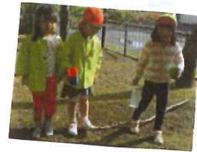
はい、コップ持てー