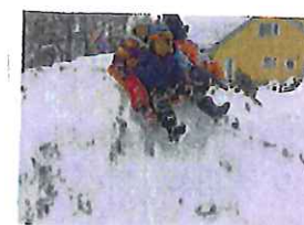
お尻滑りして 死にます。