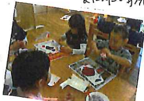
楽しんでこねました。 丸い丸い米立に。 大粒、小粒。 →