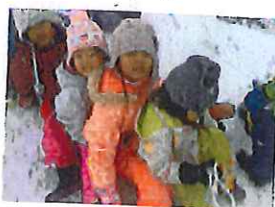
2人のろくろ作り。 4人よー。