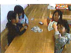
トランプだよー。 パパは誰が持っているかな?