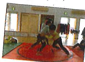
未知始まった相撲大会。 仲良しメンバーも 真実勝利!