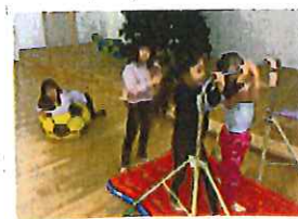
金太棒で枝を 極めたいです。大女子です。