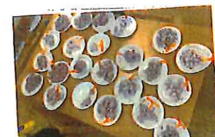
様子は おいしくな らびょう完成!