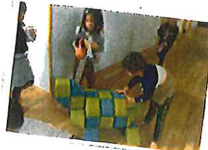
カクサーン、 待てー。