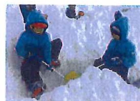
"人石"か 飛ぶお山。 山。たくさん作り出せ!!