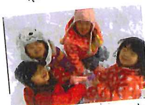
集合して何やら楽しい事が 始まるよ。