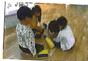
里子球をやる為には フープボールも作っています。