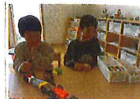
ん、どうしてかなー。