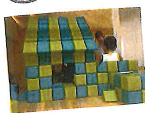
完付きのマホム。 由もたのよ。