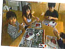
白い粘土を着色しては。 紫色を混ぜて、よかく ユネユネ。根気よく、皆