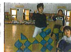
バク完成!!。 乗っても大丈夫かな?