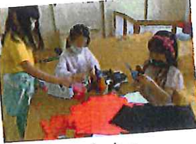
いつでも自由に 製作遊び。必要は材料 は揃っていますか。