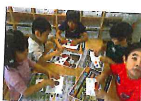
<糸の感覚をどう作り> 絵の具を混ぜて紫色を作り出した。 赤紫、青紫と1人ひとり違う紫に。