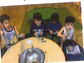
クリスマスリースの 毛糸のポンポン作り。 また、最後はキレイに毛糸をカットです。