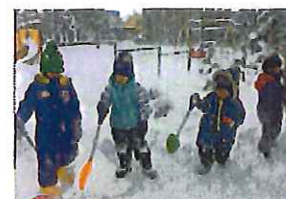
さあ、何から始める? かまこら作りチーム。