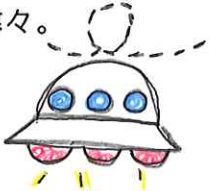
キラキラたいよう。作:こせいちゅ。