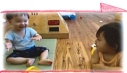
「ねえねえ、いっしょにあそぼうよ〜」