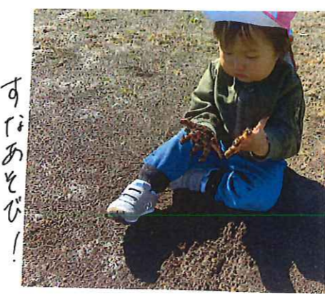
砂利のうんたごみ!